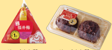
ひやくまん穀おにぎり ひやくまん穀おはぎ